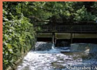
Stadtgraben / Aa

18 Der Wall . Drei Kilometer historischer „Rondengang“ auf der ehemaligen Stadtbefestigung. Viele Villen aus der Gründerzeit und der reizvolle Stadtgraben schaffen eine tolle Kulisse für Spaziergänger und Radfahrer, für groß und klein.