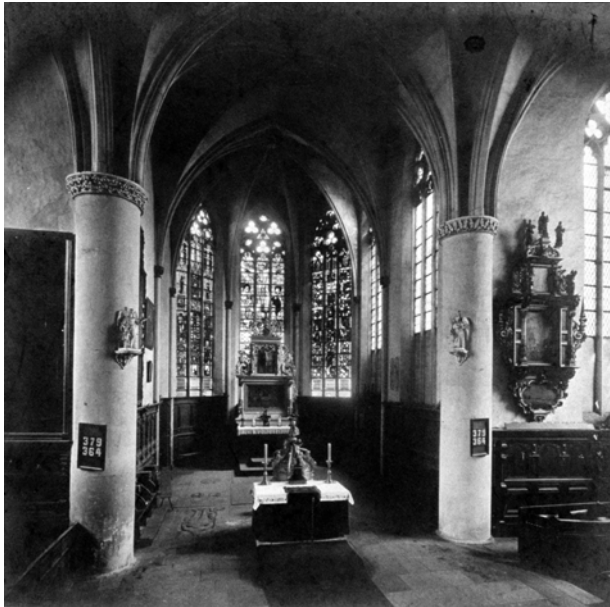
um 1900 ist das Christusbild nicht eingebaut

Für die mittelalterliche Symbolik galt die Kirche allgemein als Himmelsstadt. Mit dem Durchschreiten der dreischiffigen Hallenkirche nach Osten, begab man sich auf den Weg zu Gott, bis man sich mit Christus am Altar verbinden konnte. Viele Zahlen, Zeichen und Symbole begleiteten diesen Weg. Oft führen drei Stufen zum erhöhten Chor, Relikt der Romanik, als darunter noch die Krypta lag. Der Chor, manchmal mit einer Apsis als Abschluss, mit drei gestalteten dreibahnigen Fenstern. Die Zahl drei steht symbolisch für die Trinität Gott Vater, Sohn und Heiliger Geist.