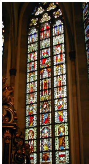
nach der Neugestaltung