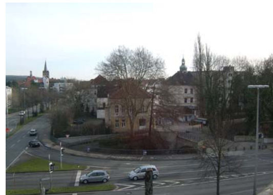
Gleicher Blick 2008

Der Bereich am Steintor wurde von 1957 an vollkommen verändert. Von hier aus wurde eine neue Verkehrsstraße quer durch die Stadt gebrochen.