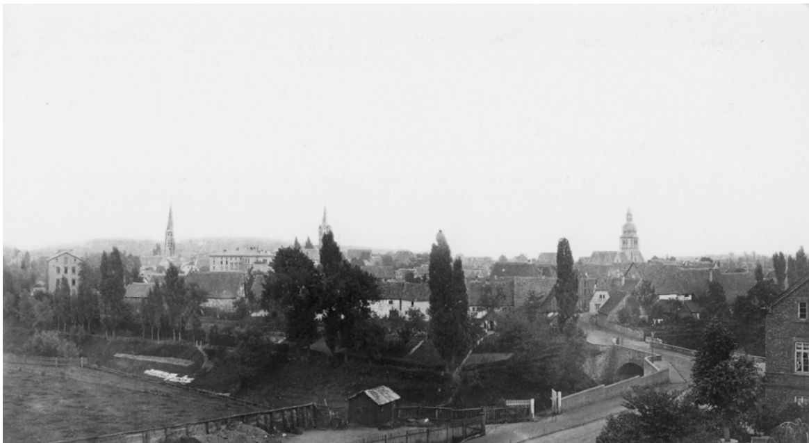
Fotographie um 1870

Vor kurzem tauchte folgende Photographie auf.