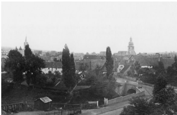
Detail am Steintor 1870

Vermutlich fotografierte Schuch selbst die Situation und machte zusätzlich Skizzen von Personen, die er später in das Bild hineindrapierte. Durch die Datierung des Stiches lässt sich auch das Alter der Photographie bestimmen, mit fast 140 Jahren ist sie eine der ältesten mit einem Motiv der Stadt Herford.