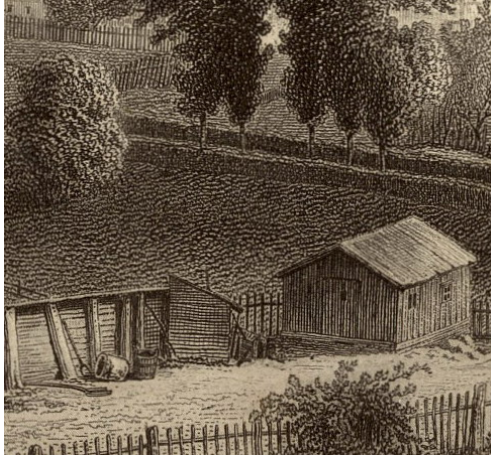
Bis ins Detail hat Schuch die Fotovorlage kopiert.

Bis ins Detail hat Schuch die Fotovorlage kopiert. Besonders auffällig ist das im unteren Bereich. Selbst Einzelheiten wie schiefe Zaunslatten und zufällig herumliegende Schaufeln wurden von ihm übernommen.