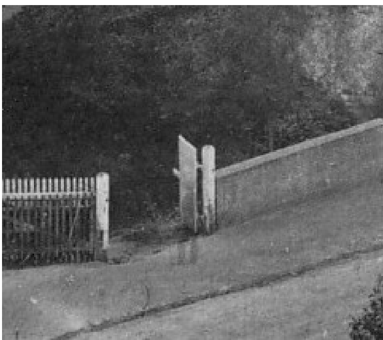
Am rechten Pfosten steht schemenhaft eine Person

Bei genauer Betrachtung wird deutlich, dass Schuch diese Photographie als Vorlage für seine Zeichnung nahm. „ Das Gespür für kompositorische Akzente in einer vorgegebenen, wenig spektakulären Topographie... “ erweist sich als Zufallsprodukt. Bis auf die vier Personen rechts im Vordergrund wurde die Vorlage der Photographie exakt übernommen. Durch die lange Belichtungszeit blieben sich bewegende Objekte meist unsichtbar. Betrachtet man das Foto genauer, kann man schemenhaft vor der offenen Tür im Zaun den Umriss eines Mannes erkennen.