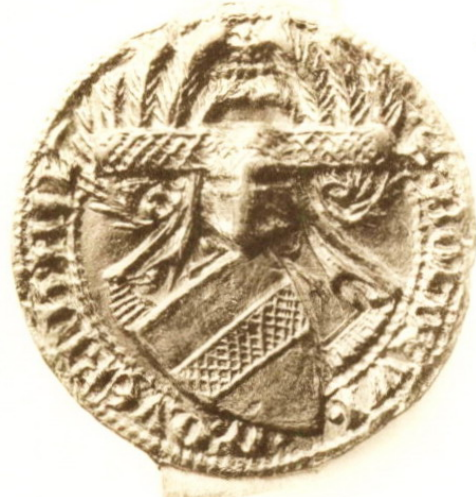
Wappen des Balduin von Quernheim