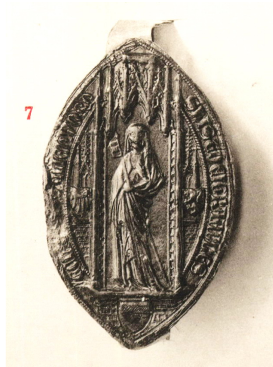
Siegel der Äbtissin Elisabeth von Herford, 1365

Aus der Entwicklungsgeschichte der mittelalterlichen Wappen wird deutlich, dass keinesfalls der kirchliche Stift selbst dieses Wappen entwickelt haben kann. Gertrud zu Lippe siegelt 1231 ohne Wappen, wie die nächsten Äbtissinnen auch. Als Motiv des Siegels finden sich das Bildnis Marias und kein weltliches Symbol.